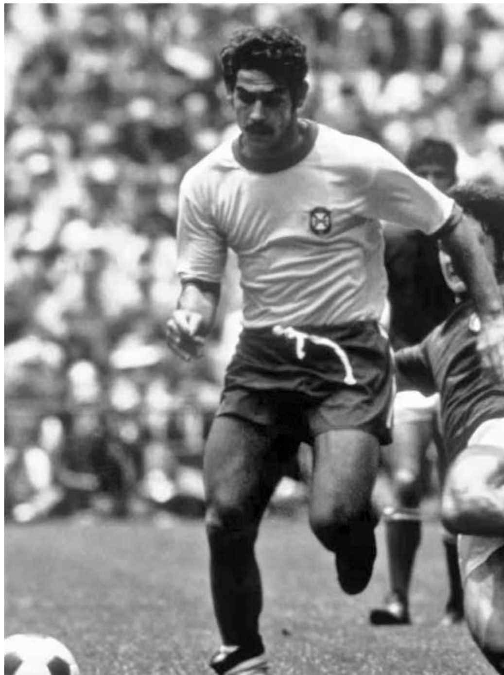
Rivellino em ação na Copa, durante a partida decisiva na vitória sobre a Itália por 4 a 1

A soberania daquela seleção não foi uma obra do acaso, mas sim o ápice de um esquadron que evoluía a cada entrada em campo. O entrosamento e a confiança do grupo