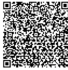
Por meio do QR Code, acesse os dados do boletim da SES

A secretaria também reforça a importância de procurar uma unidade de saúde diante dos primeiros sintomas, como febre, dor de cabeça, dores no corpo, manchas vermelhas na pele e mal-estar. Nos casos em que surgirem sinais de agravamento, como dor abdominal intensa, vômitos persistentes, sangramentos ou tontura, a recomendação é buscar atendimento imediatamente. A prevenção continua sendo a principal estratégia para reduzir a transmissão das arboviroses.