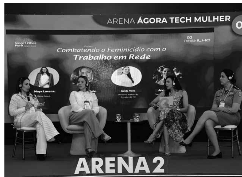
Smart Cities Park também tratou do combate à violência de gênero

A estrutura do evento conta com 12 arenas temáti-