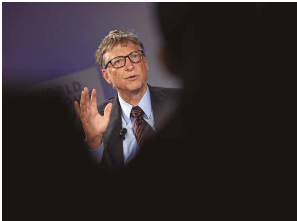
Bilionário revelou caso extracônjugal que Jeffrey Epstein usou para tentar obter vantagem

“Esses assuntos não tinham nada a ver com minhas interações com Epstein, mas foram dolorosos para minha família (...). Epstein usou informações sobre minhas infidelidades, além de muitas mentiras, para me pressionar a voltar a trabalhar com ele, mas não teve sucesso. Isso demonstra algumas das maneiras pelas quais ele tentou aproveitar