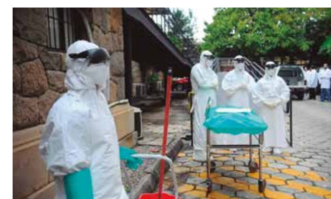
Instalação servirá para quarentena de estadunidenses

“O governo do Quênia optou, secretamente, em fazer esse acordo com o governo Trump para criar um centro de quarentena para todos os cidadãos norte-americanos no território africano que tivessem qualquer tipo de suspeita de ebola. É lógico que a juventude, e a população de Nairóbi, ficou muito apreensiva”, comenta.