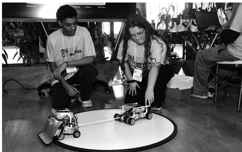
Trabalho da Ecit Professor Bráulio Maia Júnior foi destaque na abertura do evento