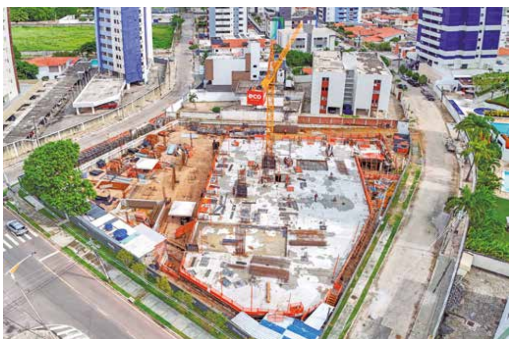
Edifícios puxam expansão do setor, concentrando quase 60% de toda a atividade no estado

“Eu pontuo muito essa questão positiva do controle urbanístico de João Pessoa, que proíbe a construção de espigões na orla.