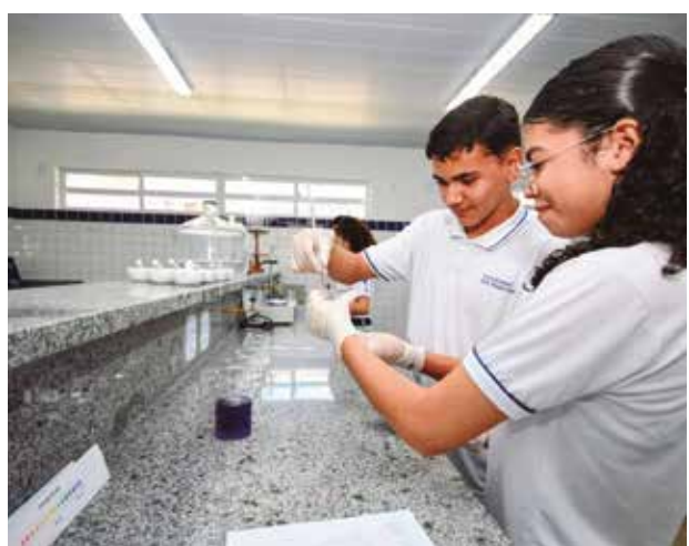
Cerca de R$ 18 milhões foram investidos no complexo