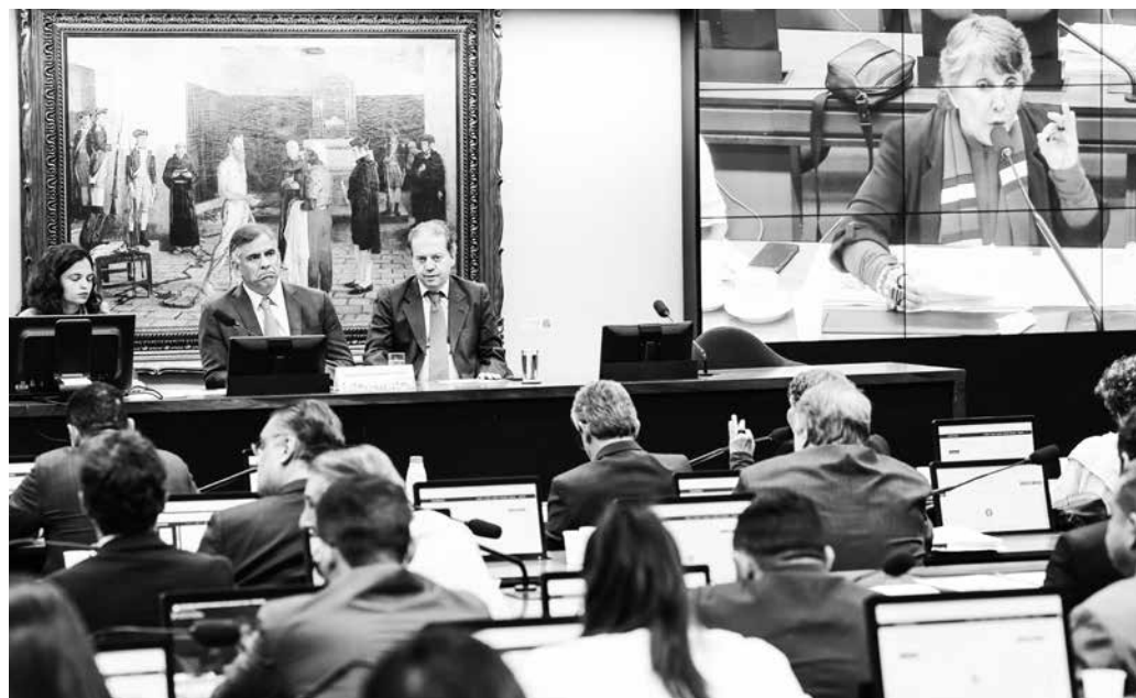
PEC nº 32/2015 recebeu 44 votos favoráveis e 18 contrários e provocou críticas na sessão

A parlamentar também argumentou que, segundo dados oficiais, apenas 0,5%