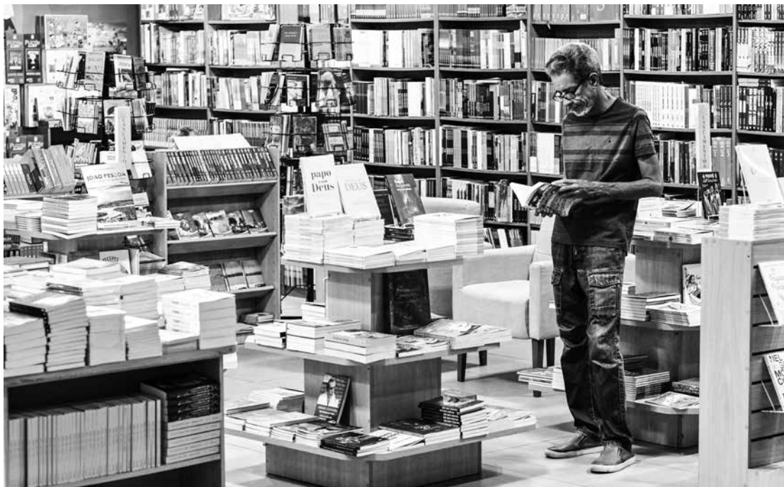
Imerso no universo da leitura