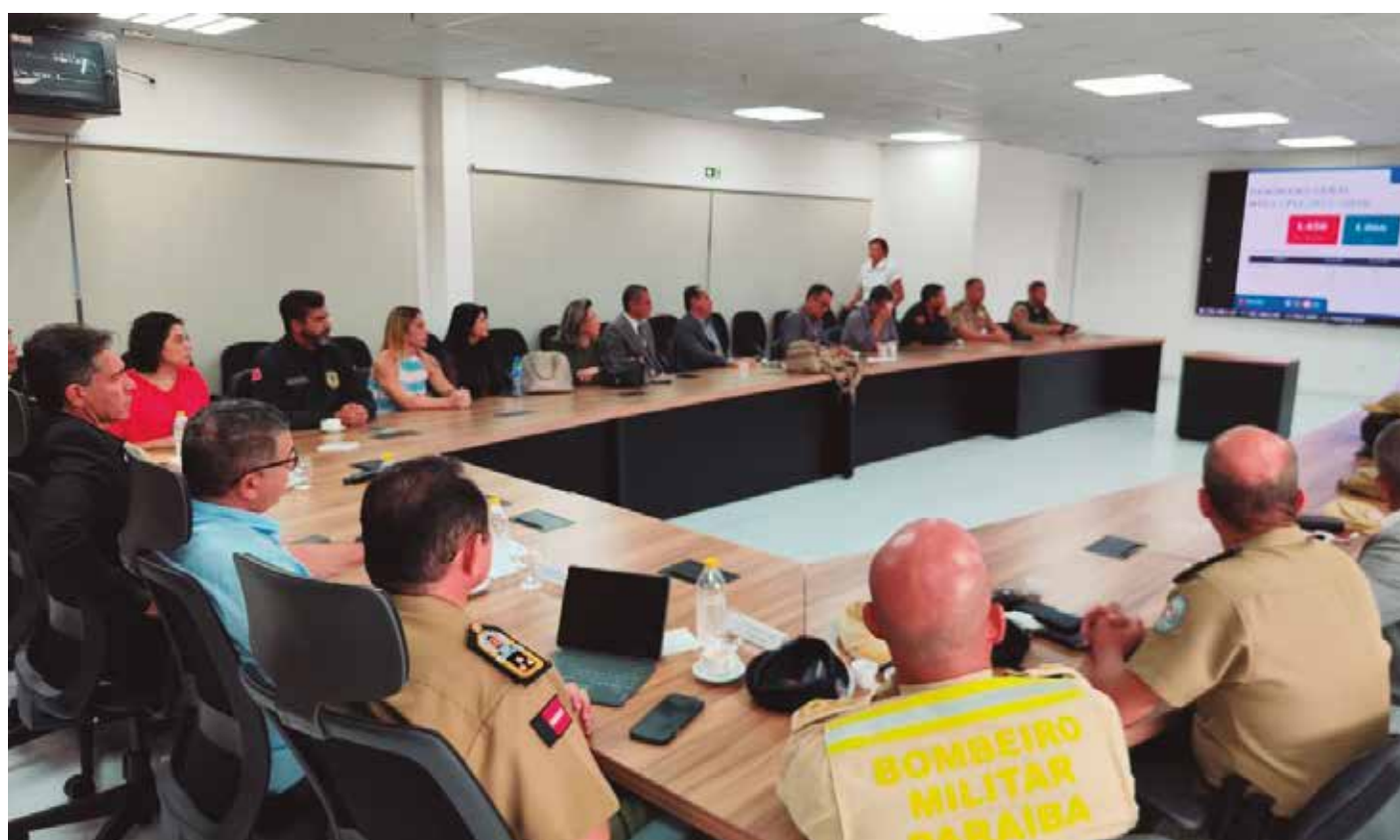
Reunião para acertar as ações das Forças de Segurança aconteceu no Centro Integrado de Comando e Controle, na capital

Durante a reunião, foram avaliados dados relacionados à dinâmica criminal da Região Metropolitana de João Pessoa, permitindo a definição de medidas operacionais voltadas ao reforço da presença das Forças de Segurança em áreas previamente mapeadas através do monitoramento e análise criminal. Entre as ações previstas, está a ampliação do policiamento ostensivo em bairros da região, com apoio de tro-