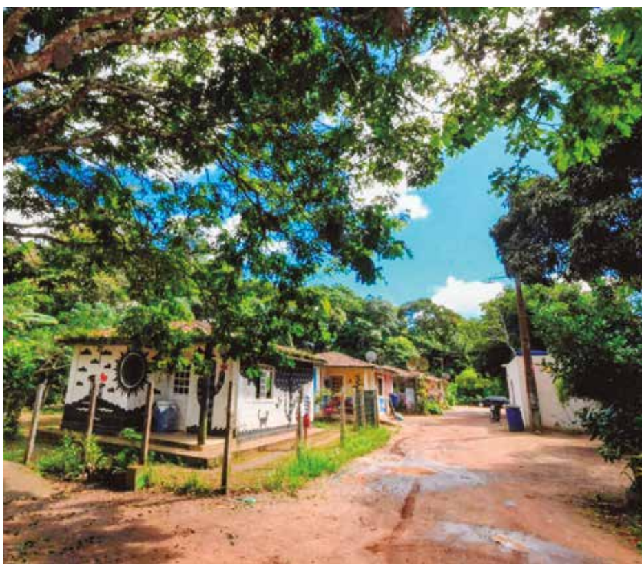
Parque Estadual Mata do Pau-Ferro receberá R$ 3,8 milhões em investimentos