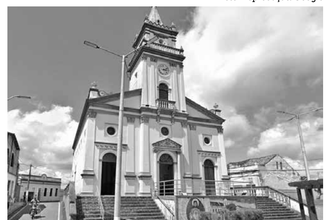
Igreja de Serraria: “beleza arquitetônica imensurável”