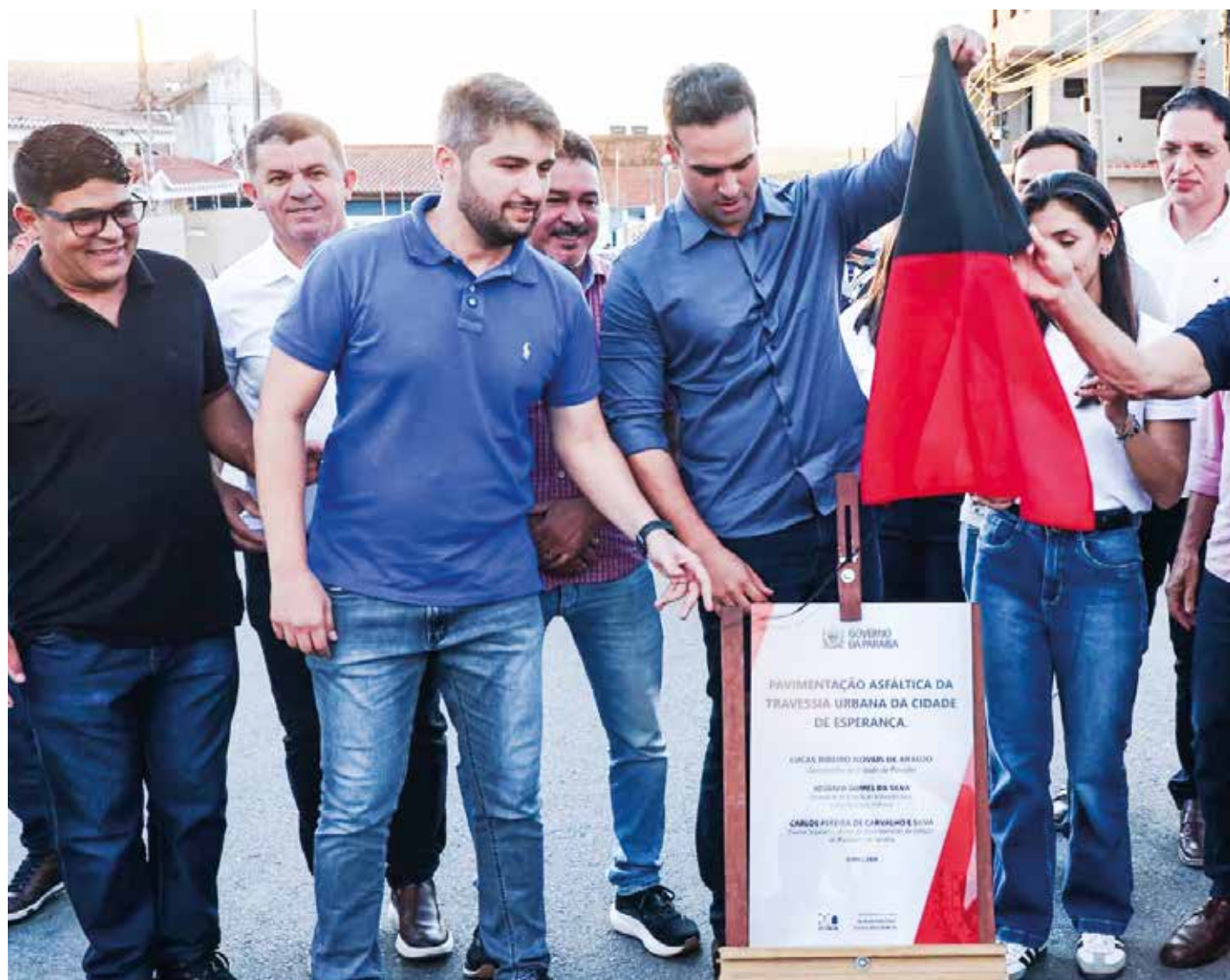
Pavimentação asfáltica em Esperança contemplou 12 ruas, totalizando 2,7 km e orçamento superior a R$ 1,6 milhão

“Hoje, damos início à elaboração do projeto dessa estrada até Areial, um sonho que começa a ser realizado. Sabemos o quanto uma estr-