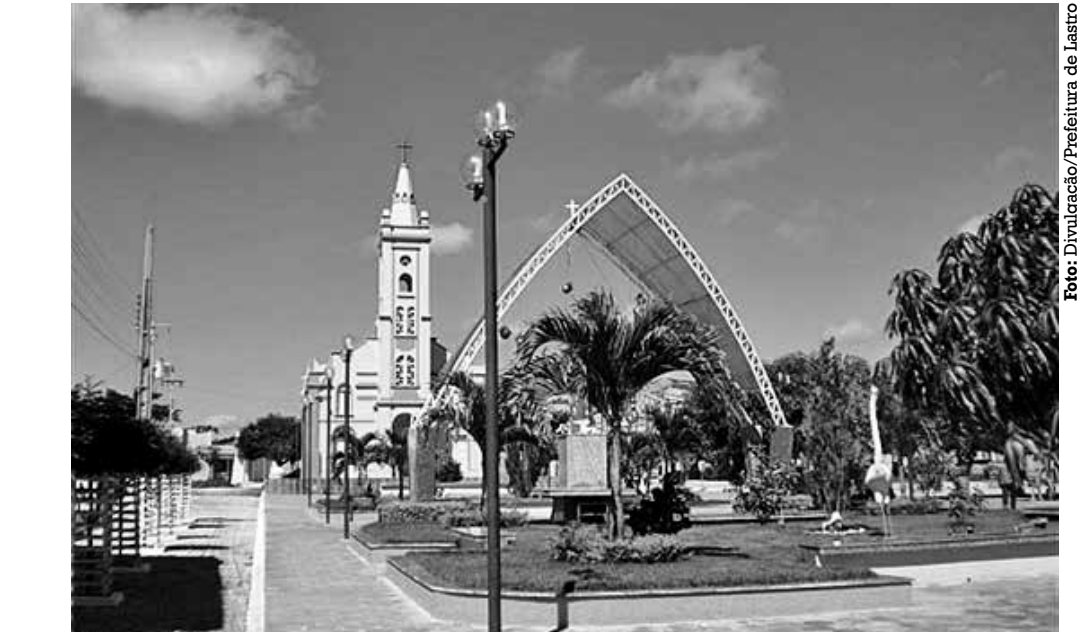
Município está na microrregião de Sousa; principal atração é a Serra da Boa Esperança