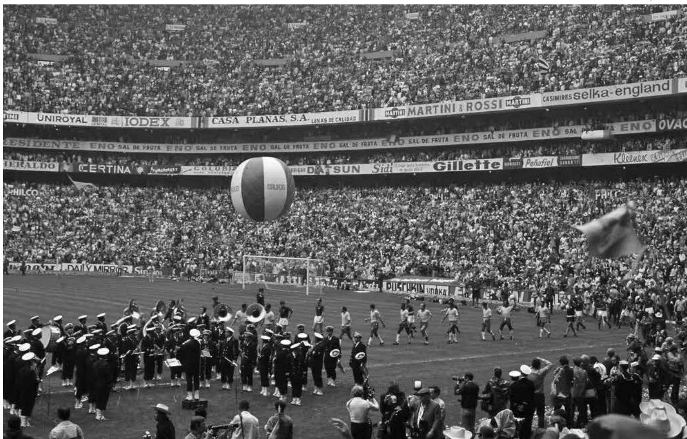
Jogadores do Brasil e da Itália entram em campo para a decisão da Copa do Mundo de 1970, no Estádio Azteca, no México

Graduado em Jornalismo pela Universidade Federal do Ceará, desde junho de 2023. Colaborador da editoria de Esportes do jornal A União (2024-Atual). Cristão convicto de que Deus tem um plano de salvação para todos nós. Politicamente, convicto de que o lado certo é o que dá alimento ao faminto, cuida das viúvas e dos órfãos, e dá repouso ao estrangeiro.