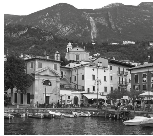
Malcesine: os reflexos de beleza nas águas cristalinas